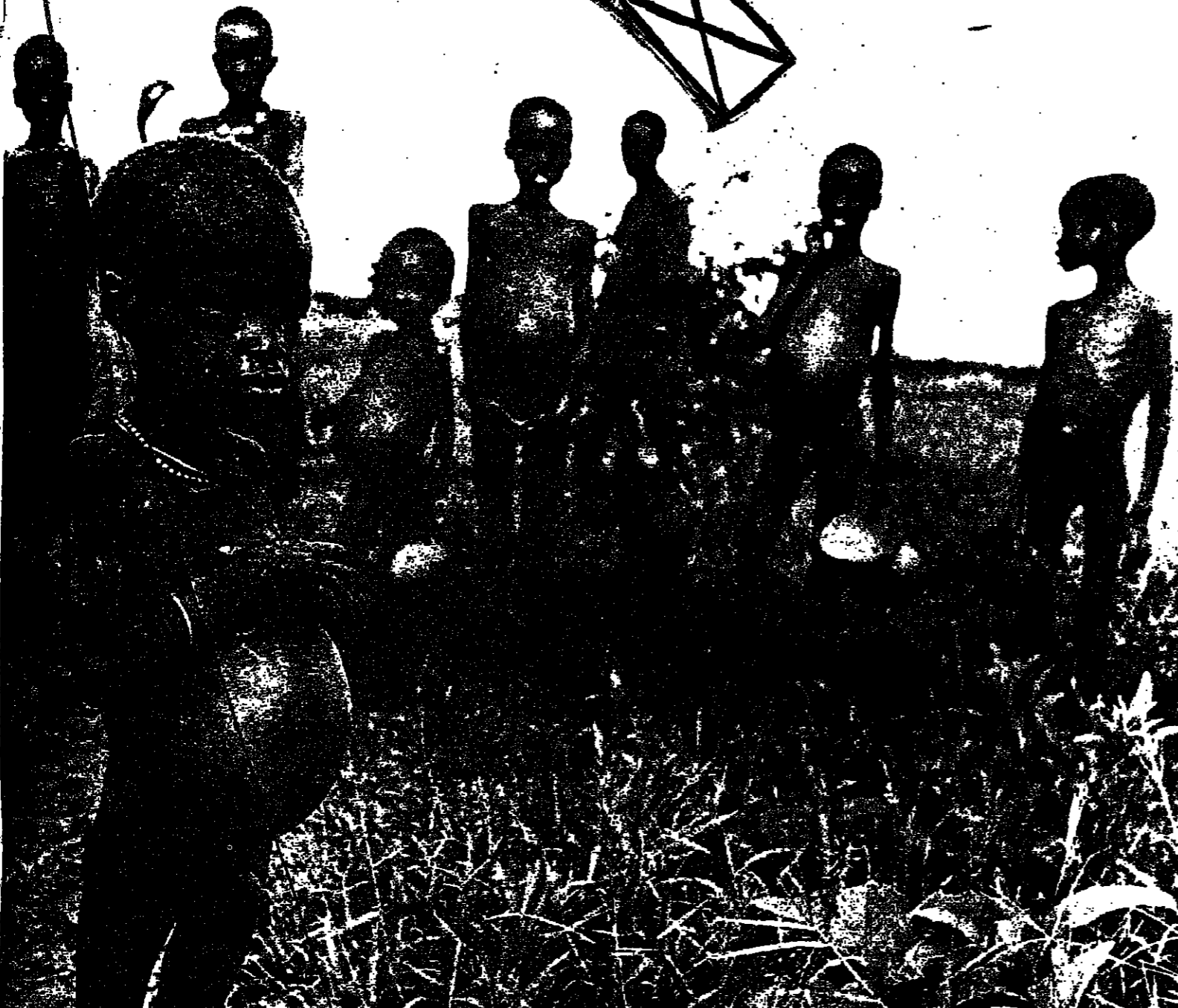
اطفال اوغنديون يجاع

في بحث علمي نشرته مجلة العلوم الأميركية (ساينس) أخيرا ، بين الباحثان بيبل وباركس من كندا نتائج التجربة التي أجريها على شعر عدد من أطفال المدارس من أجل الاستدلال على قدرتهم الذهنية لاستيعاب الدروس . ولقد أجريت التجربة على نحو ٥٠٠ طفل ، نصفهم من لهم مستوى متوسط أو فوق المتوسط من حيث القدرة على استيعاب مناهج الدراسة ، والنصف الآخر من دون المتوسط . فحص الباحثان عينات من شعر هؤلاء الأطفال بقصد التعرف على محتواها الكمي لاربع عشرة عنصرا من العناصر المختلفة مثل الكالسيوم والماغنسيوم ، والبوتاسيوم والصوديوم والرصاص والكلورين وغيرها . وبينت نتائج البحث عدم وجود فرق معنوية واضحة بين محتوى شعر الأطفال متوسطي القدرة الاستيعابية المدرسية وبين هؤلاء ذوي المستوى دون المتوسط لخاصية العنصر التي تم فحصها ، باستثناء أربعة عناصر هي : الرصاص والكلورين والفلورين والكوبلت . حيث كان محتوى شعر